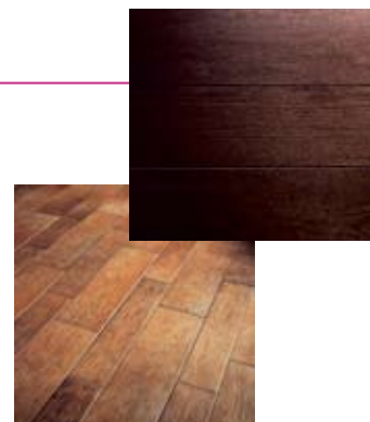
KERAMICKÉ DŘEVO , dlažba ROVERE PEPE a IROKO NOCCIOLA, v pěti barevných odstínech, cena k doptání ve studiu ASSO