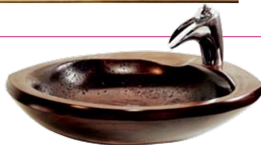
BANDIT ALFA , umyvadlo z přírodního amerického ořechu, 1 600 € (VAUU)