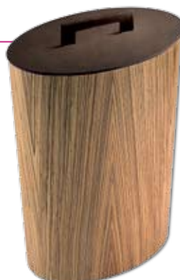
SECIORI , dřevěný koš s koženým víkem od LINEABETA, 12 890 Kč (KOUPELNOVÝ ESHOP)