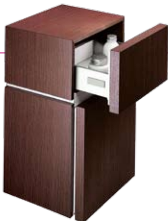
VARIUS , boční závěsná skříňka, dekor dřeva wengé, 10 050 Kč (SANITEC)