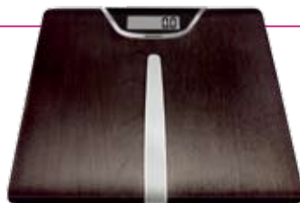
LEGNO 63200 , digitální váha, nosnost 150kg, povrch z pravého dřeva, cena od 1 153 Kč (LEIFHEIT)

Elegantní mozaiky z pravého dřeva se pro změnu tváří jako keramika a díky odolnosti a impregnaci pod tlakem dosahují jejich kvalit. Jsou připraveny k použití na stěny, podlahu, na strop i do vlhka. V nabídce najdete tvrdé dřeviny s různou kresbou a barvou – bambus, teak, wengé, dub či kanadský javor, ale zároveň formáty od 2x2cm až po 10x10cm. Počítejte však s tím, že taková podlaha je nadstandardní záležitost a připravte se na ceny od 4 000 do 6 000 Kč/m 2 .