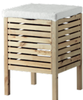
MOLGER , stolička s úložným prostorem, masivní bříza, 38x38x50 cm, 849 Kč (IKEA)